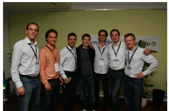
Mark Zuckerberg, el fundador de Facebook visita amiando en su oficina de Múnich